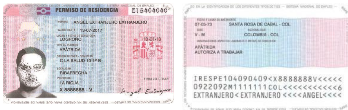
Art.15 Documento de identidad de apátridas. Indicador restricción: N.

La inscripción se produce sin ninguna limitación , salvo la derivada de la propia vigencia del documento de identidad que deberá ser comprobada por el empresario antes del inicio de la actividad laboral.