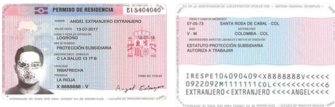
Art.14 Documento de derecho de la protección subsidiaria y de los familiares a quienes se haya reconocido la extensión familiar para residir en España. Indicador restricción: N.

Personas que, sin reunir los requisitos para obtener el asilo o ser reconocidas como refugiadas, existen motivos fundados para creer que si regresasen a su país de origen en el caso de los nacionales o, al de su anterior residencia habitual en el caso de los apátridas, se enfrentarían a un riesgo real de sufrir alguno de los daños graves previstos, y que no pueden o, a causa de dicho riesgo, no quieren, acogerse a la protección del país de que se trate.