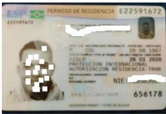
Art.13 Documento de derecho a asilo. Indicador restricción: N.

Personas que, debido a fundados temores de ser perseguida por motivos de raza, religión, nacionalidad, opiniones políticas, pertenencia a determinado grupo social, de género u orientación sexual, se encuentran fuera de su país y no pueden o no quieren acogerse a la protección de tal país, o al apátrida que, careciendo de nacionalidad y hallándose fuera del país donde antes tuviera su residencia habitual, por los mismos motivos no puede o, no quiere regresar a él.